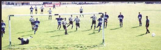
ΠΑΝΑΙΓΓΑΛΕΙΟΣ - ΑΓ. ΝΙΚΟΛΑΟΣ 1-0