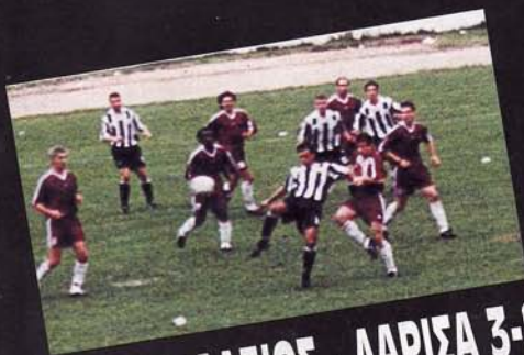
ΠΑΝΑΙΓΓΑΛΕΙΟΣ - ΛΑΡΙΣΣΑ 3-2