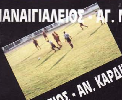
ΠΑΝΑΙΓΓΑΛΕΙΟΣ - ΑΝ. ΚΑΡΔΙΤΣΑΣ 2-1