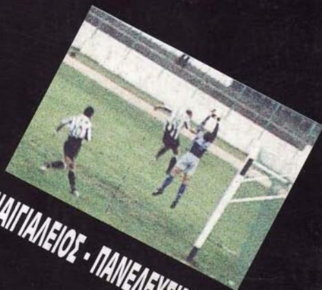
ΠΑΝΑΙΓΓΑΛΕΙΟΣ - ΠΑΝΕΠΙΛΕΥΣΙΝΙΑΚΟΣ 1-0